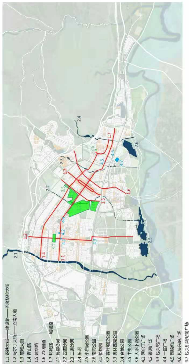
城市重要公共空间图